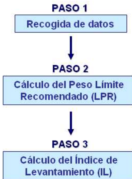
Figura 1. Proceso de evaluación

Una vez analizadas estas cuestiones se procede a realizar la evaluación, que consta, a su vez, de tres pasos: