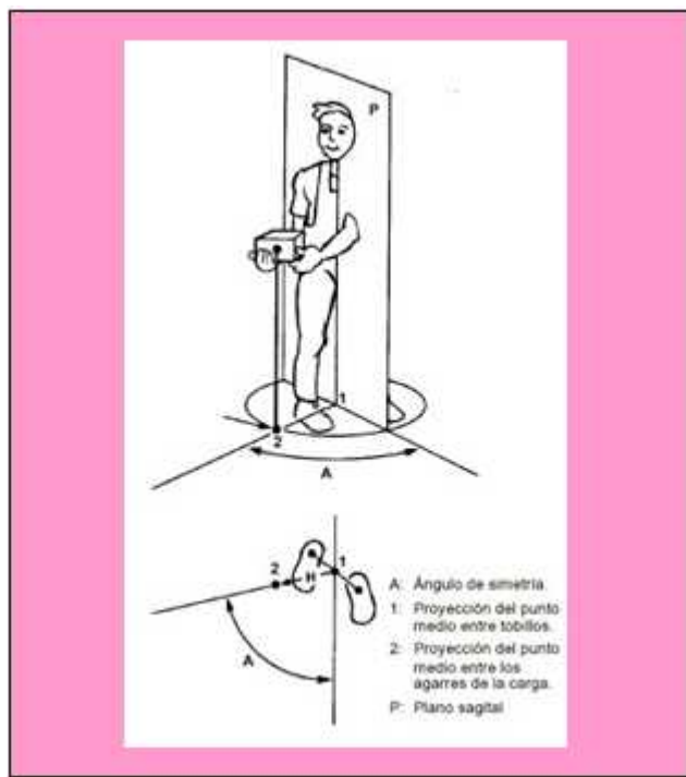
Figura 3. Ángulo de asimetría del levantamiento (A)

Es la medida angular del desplazamiento del objeto en el plano medio sagital del trabajador, en grados.